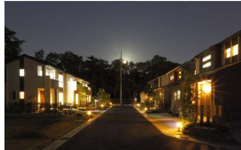
環境に配慮した浜松市初のスマートタウン 「サーラスマートタウン幸」