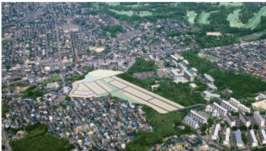
名古屋市内で全 178 区画の単独開発を行った 「サーラヒルズ牧野ヶ池緑地」

100 区画以上の大規模分譲開発や、ワンランク上の設備仕様を採用した高額分譲プロジェクト、スマートハウスをコンセプトにしたスマートタウンの開発など、様々な分譲地開発を行ってきました。これまでも、これからも、当社は地域の特性や時代のニーズを踏まえ、周辺環境との調和を大切にしながら、暮らしやすく美しい住空間をご提供し続けていきます。